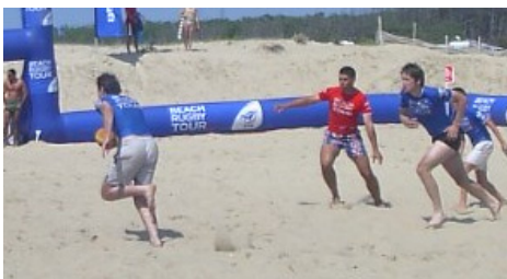
Quart de finale du Beach Rugby Tour 04 de Montalivet (33)