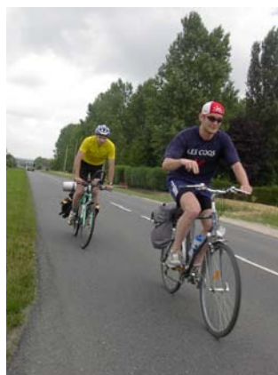
En haut d'une courte côte