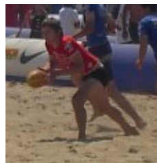
Finale du Beach Rugby Tour 04 de Montalivet