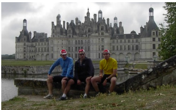
Repos à Chambord (41)

En outre, le 30 juillet se déroulait une étape du « Beach Rugby Tour » à Montalivet les bains (33) organisé par la Fédération française de Rugby. L'équipe Vélovalie y a participé et a même disputé la finale de ce tournoi, réunissant une quinzaine d'équipes.